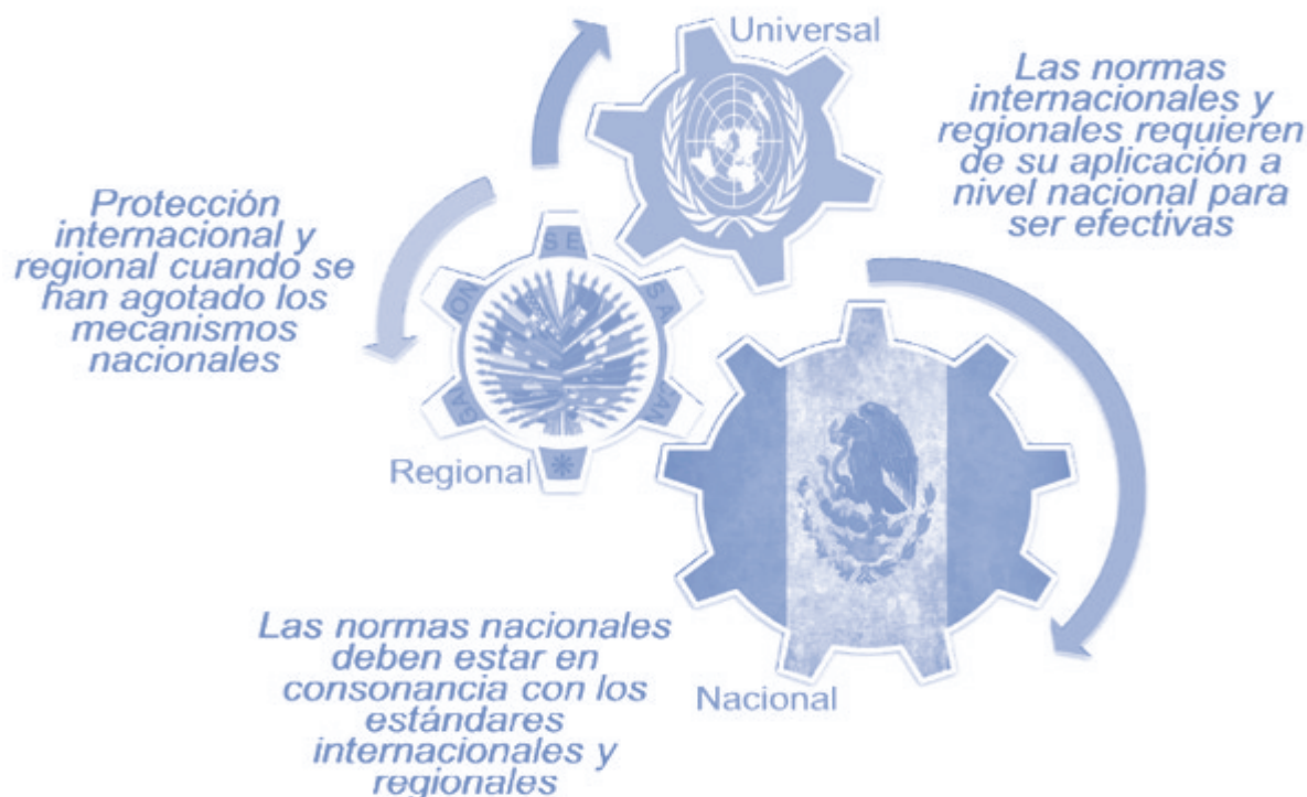
Diagrama 2. Vínculos entre los sistemas universal, regional y nacional de protección de los derechos humanos

A continuación, habiendo ya revisado cuál es el tipo de contenido que las normas e instrumentos del Derecho Internacional de los Derechos Humanos ofrecen para la construcción de los derechos humanos y las obligaciones de los Estados, retomaremos el tema de las fuentes del DIDH.